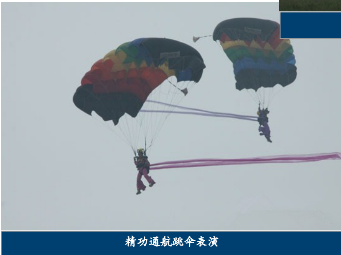
精功通航跳伞表演