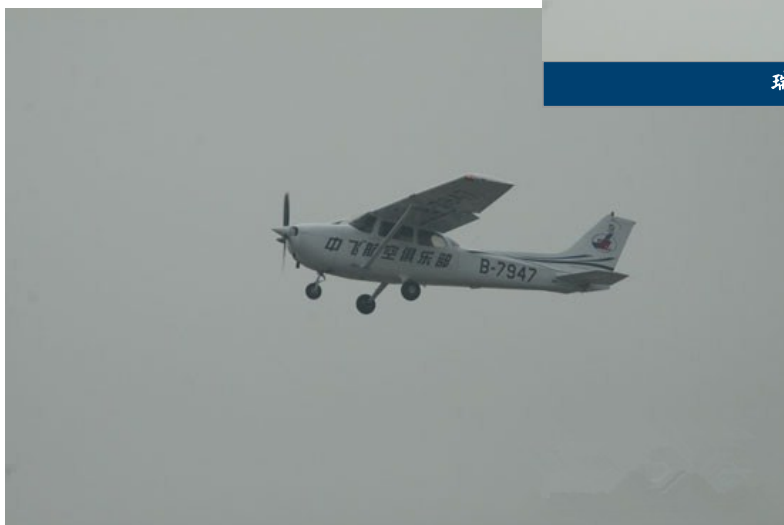
中飞俱乐部飞行表演