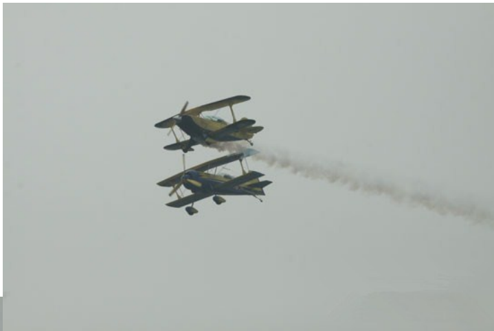
瑞典飞行队双机特技表演

18日上午，在西安蒲城的内府机场举行了飞行表演和飞机静态展，来自世界各地的飞行好手和飞行爱好者，以及上万名观众参加了今天的活动。有近100架飞机参与了展示，国产各种通用飞机进行了飞行表演，瑞典“斯堪的纳维亚”特技飞行队，维京、大黄蜂、雅克50、雅克20、优卡等飞机表演了特技飞行。