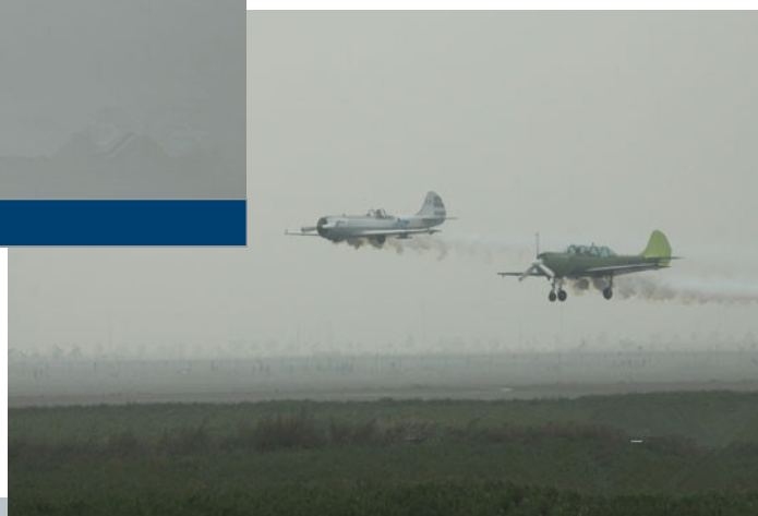
立陶宛飞行队雅克50、52双机表演